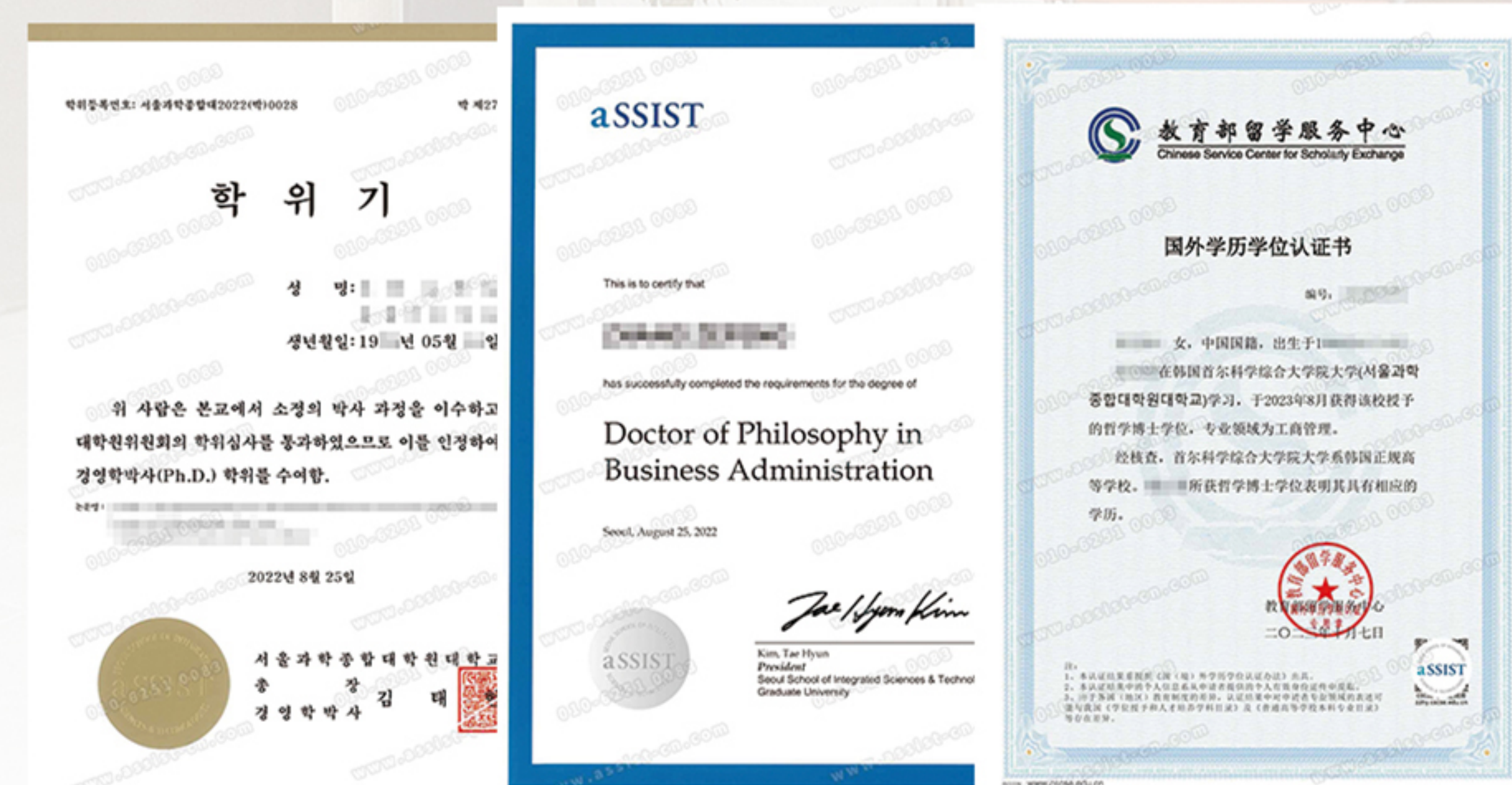
aSSIST博士学位证书韩文版、英文版、中国教育部博士国外学历学位认证书