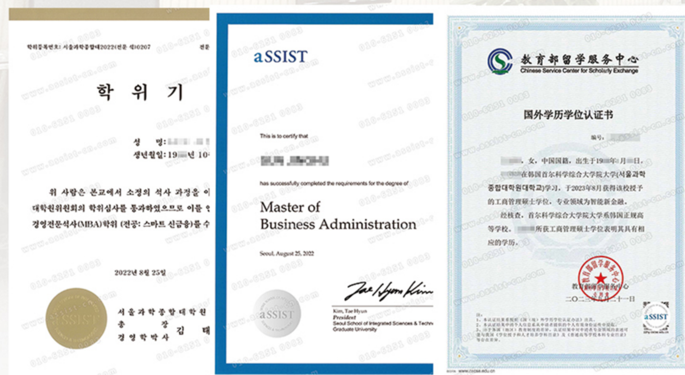
aSSIST硕士学位证书韩文版、英文版、中国教育部硕士国外学历学位认证书